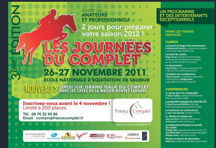
Affiche Format A 3

A titre indicatif, le site France Complet est en moyenne visité 30 000 fois par mois (soit près de 1 500 visites par jour)