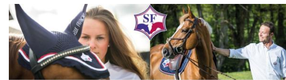
COLLECTION FEMME COLLECTION HOMME

Le présentateur du cheval et le cavalier devront porter la tenue du stud book de leur cheval: Selle Français ou Anglo Arabe.