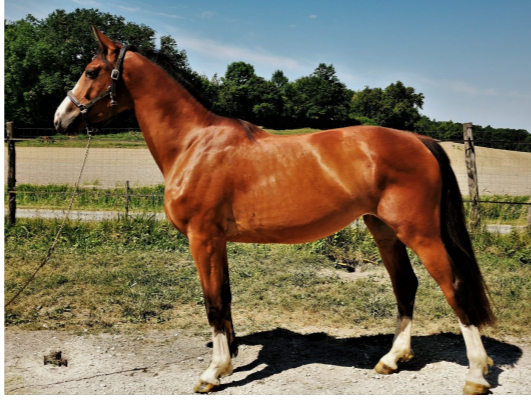
Exemple d'une belle photo de modèle (ici avec Histoire des Gironnets )

NB : les photos doivent être au format jpg ou png.