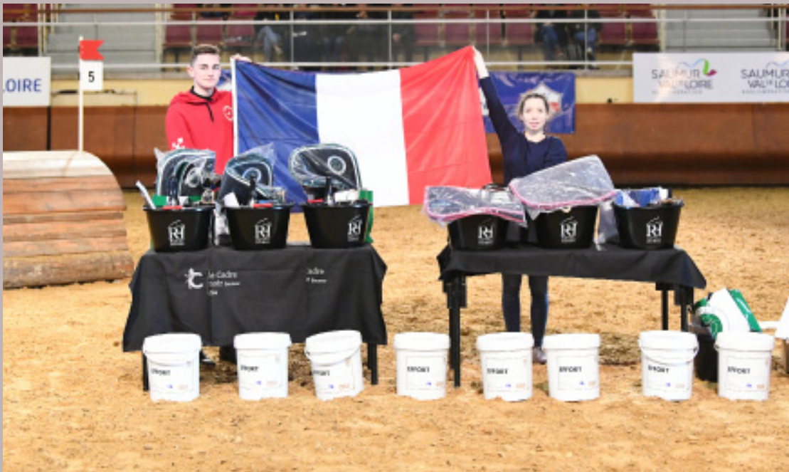
Remise des Prix 2020