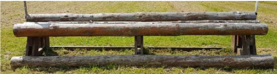
Obstacle 1: 82cm de haut – 85cm de large