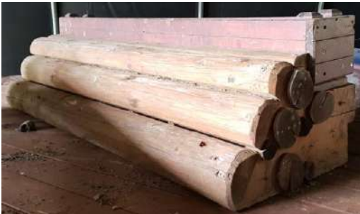
Obstacle 2: 4m de front – 90cm de haut avec haie – 60m de large